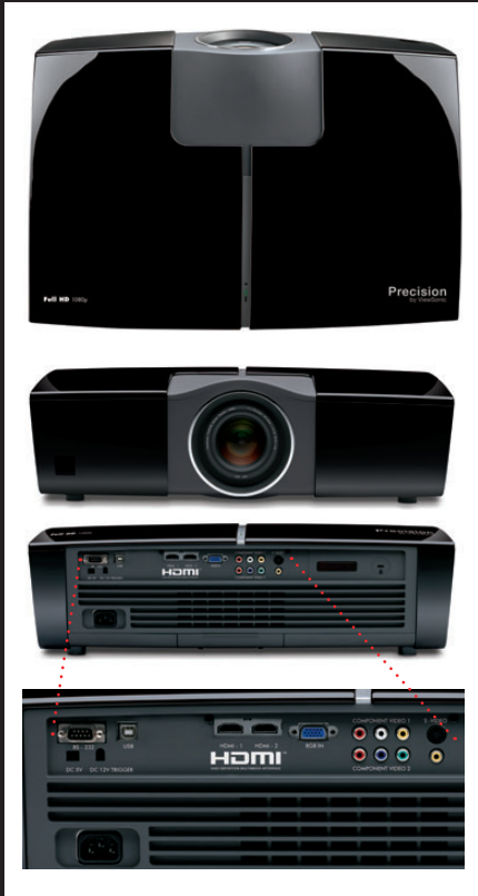
Schwarzes Top-Cover ist im Lieferumfang enthalten. Optional erhältlich: Weiß, Schiefergrau und Burgunderrot

1080p Heimkino-Projektor mit Precision Color System™